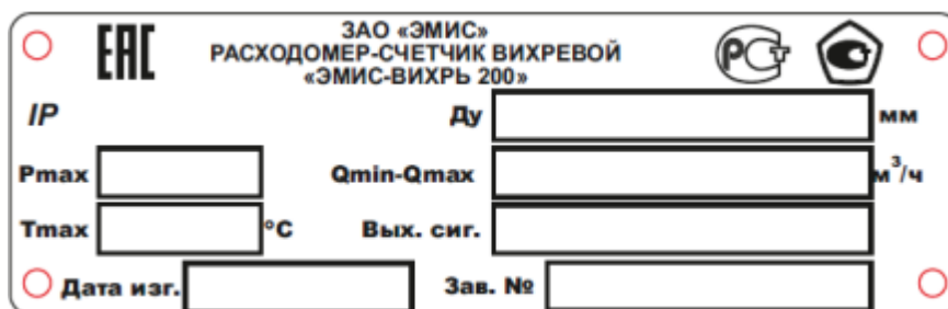
Рисунок 7 - Пример маркировочной таблички